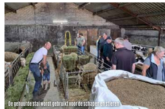
De gehuurde stal wordt gebruikt voor de schapen en stieren

Vervolgens zijn we doorgerezen naar een eetcafé in de buurt waar we heerlijk hebben gegeten en het eerste bedrijf konden evalueren.