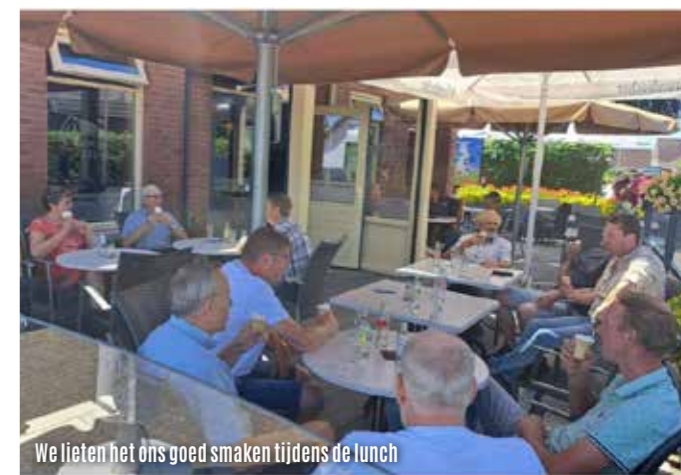
We lieten het ons goed smaken tijdens de lunch