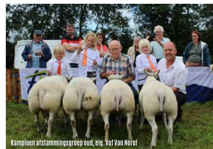
Kampioen afstammingsgroep oud, eig. Vof Van Norel