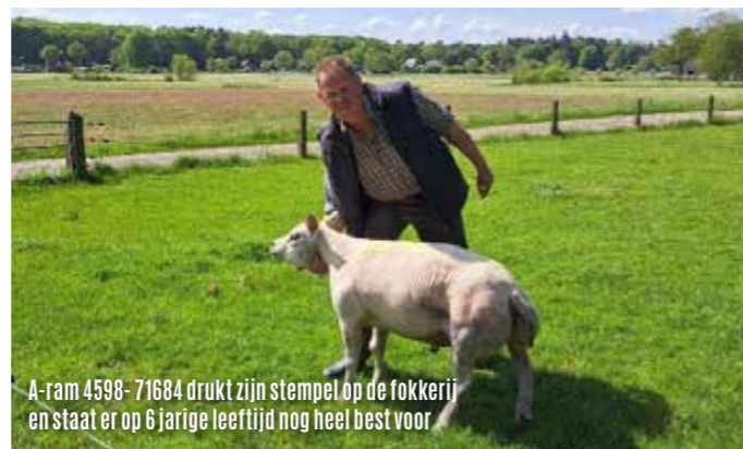
A-ram 4598-71684 drukt zijn stempel op de fokkerij en staat er op 6 jarige leeftijd nog heel best voor