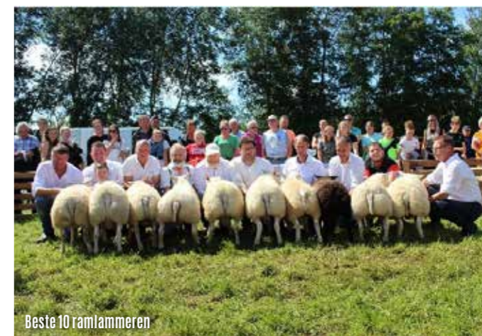
Beste 10 ramlammeren