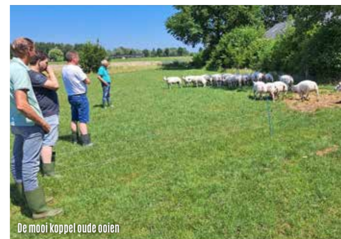
De mooi koppel oude ooiën