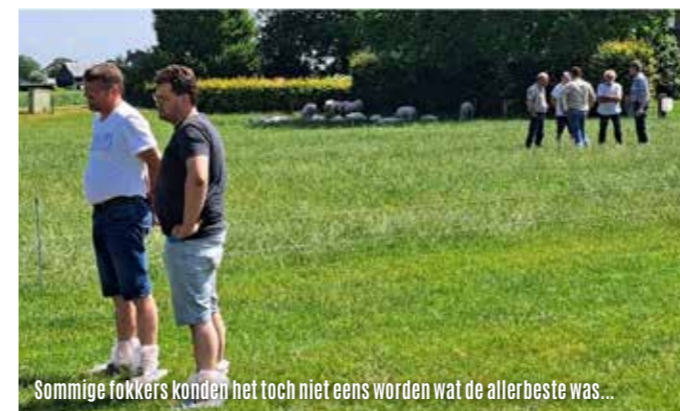
Sommige fokkers konden het toch niet eens worden wat de allerbeste was...