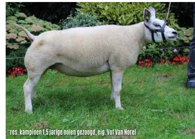
res. kampioen 1,5 jarige oaien gezoogd, eig. Vof Van Norel