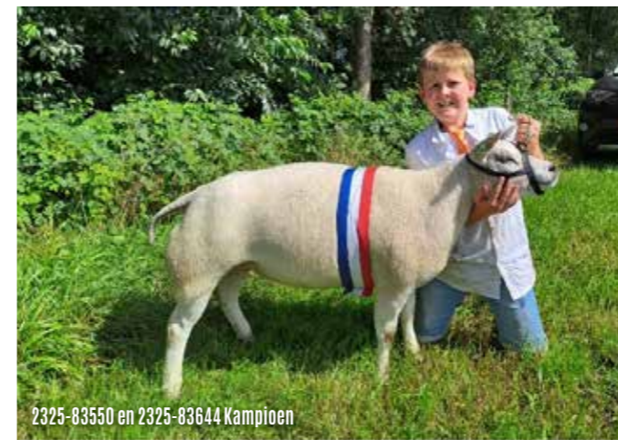
2325-83550 en 2325-83644 Kampioen