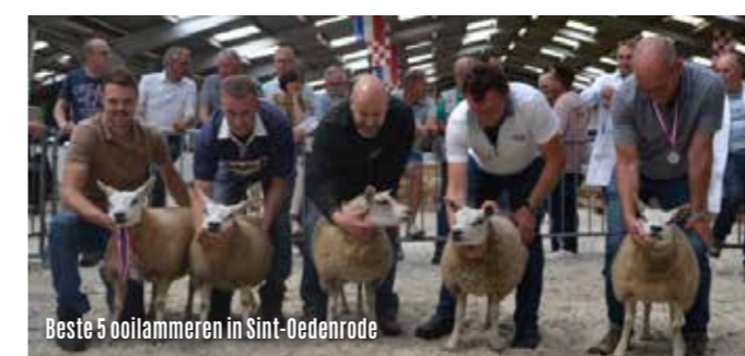
Beste 5 ooilammeren in Sint-Oedenrode

Het jaar 2023 gaat de boeken in als een jaar waarin er weer ruimte was om een volledig programma te draaien na de coronamaatregelen in 2022 en waarin een aantal fokkers uit Gelderland zich hebben aangesloten bij onze afdeling. Dit bracht een naamsverandering te weeg; NTS Zuid werd NTS Zuid-Oost. Nogmaals een hartelijk welkom aan alle fokkers die zich bij onze afdeling hebben aangesloten. Anderzijds was 2023 ook het jaar waarin blauwtong terugkwam in Nederland. Begin september werd het virus voor het eerst vastgesteld in ons land en hier hebben verschillende fokkers van onze afdeling veel last van gehad. Hopelijk wordt er snel een vaccin goedgekeurd en kan op deze manier verder leed bespaard worden.