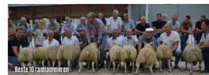
Beste 10 ramlammeren