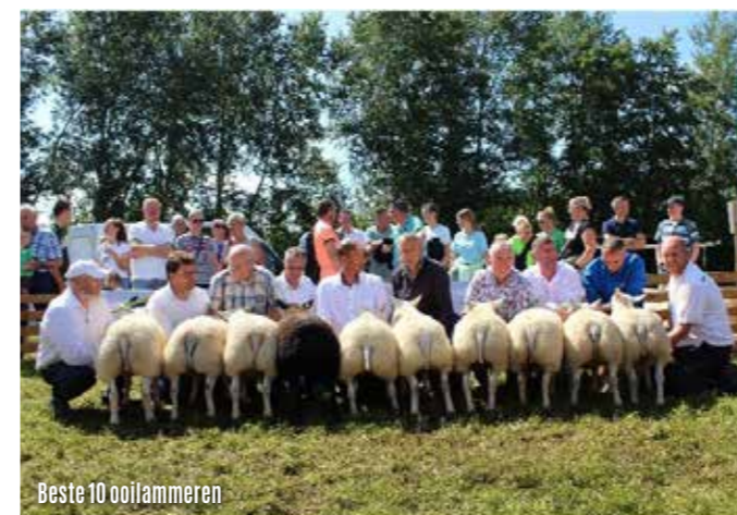
Beste 10 oailammeren