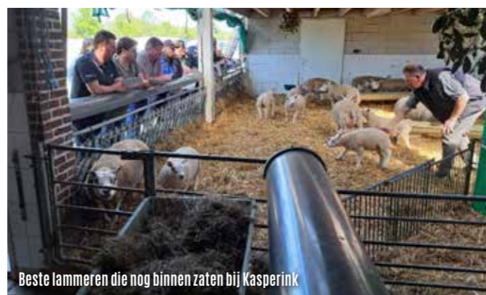
Beste lammeren die nog binnen zaten bij Kasperink